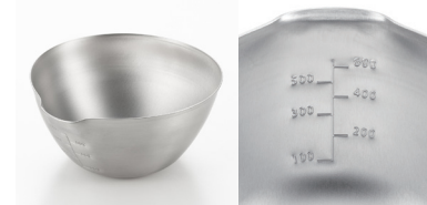
aikata 单导流口不锈钢碗(大)

PD3022/4979487 330220 材質 / 304不锈钢, 容量530ml 尺寸 / 大约 12×13.3cm, 88g 食洗機対応 / 可用洗碗机清洗