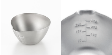
aikata 单导流口不锈钢碗(小)

PD3022/4979487 330220 材質 / 304不锈钢, 容量530ml 尺寸 / 大约 12×13.3cm, 88g 食洗機対応 / 可用洗碗机清洗