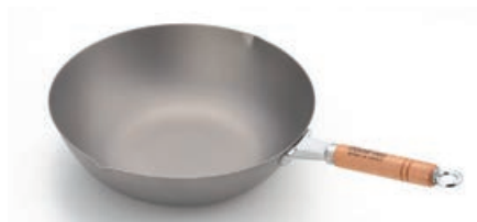
YJ2700 JAN: 4979487 927000 COOK-PAL 纯钛炒锅 33cm ●产品尺寸(mm): A545、B330、C95、D130 ●产品重量: 890g