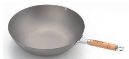
YJ2701 JAN: 4979487 927017 COOK-PAL 纯钛炒锅 36cm ●产品尺寸(mm): A570、B360、C100、D130 ●产品重量: 1040g