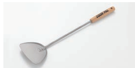
YJ3174 JAN: 4979487 931748 COOK-PAL 纯钛铲子 ●产品尺寸(mm): A403、B107 ●产品重量: 110g