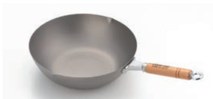
YJ3172 JAN: 4979487 931724 COOK-PAL 纯钛炒锅 30cm ●产品尺寸(mm): A513、B300、C90、D125 ●产品重量: 780g