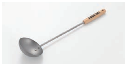
YJ3173 JAN: 4979487 931731 COOK-PAL 纯钛勺子 ●产品尺寸(mm): A410、B98 ●产品重量: 130g